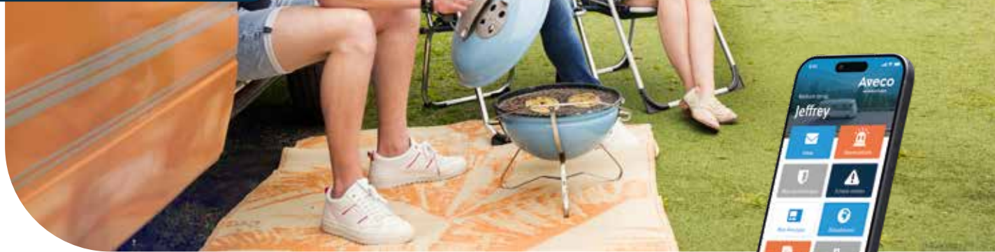
Aveco reist met je mee

We werken persoonlijk én met grote liefde voor kamperen. Onze mensen zijn echte kampeerliefhebbers. Je krijgt dus altijd een betrokken specialist aan de lijn die jouw camper kent. Dit helpt je om de beste keuzes te maken voor jouw camperverzekering.